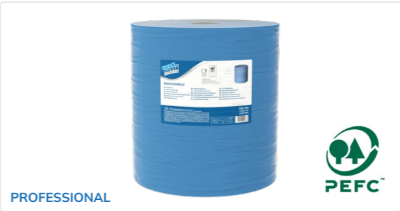
Wischtuchrolle PRO 252