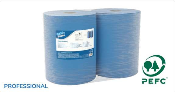
Wischtuchrolle PRO 251